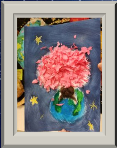
まがしつ しょう マンガ教室みなとみらい賞 えみふる