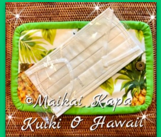
デザイン① プアケニケニ