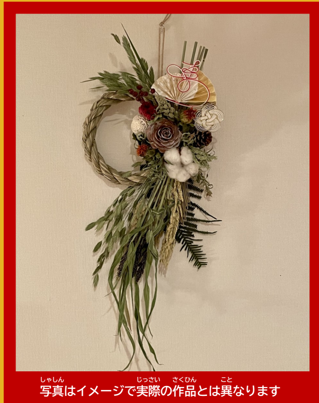
しゃしん じっさい さくひん こと 写真はイメージで実際の作品とは異なります