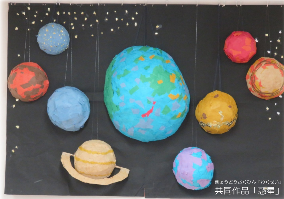
きょうどうさくひん「わくせい」 共同作品「惑星」